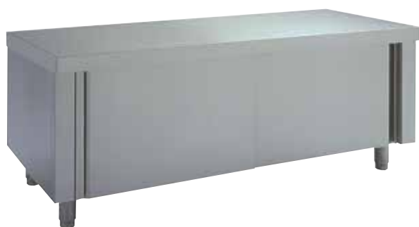
Rozsdamentes acél kivitel, tolóajtóval.