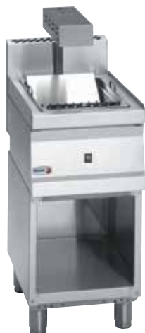
MF6-05 + MB6-05