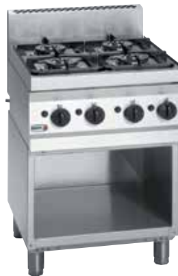
CG6-40 + MB6-10