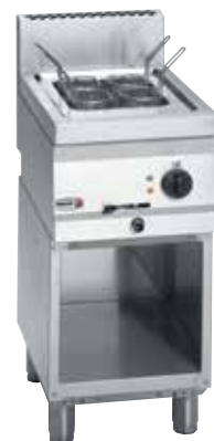
CPE6-05 + MB6-05