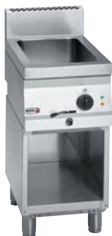
BME6-05 + MB6-05