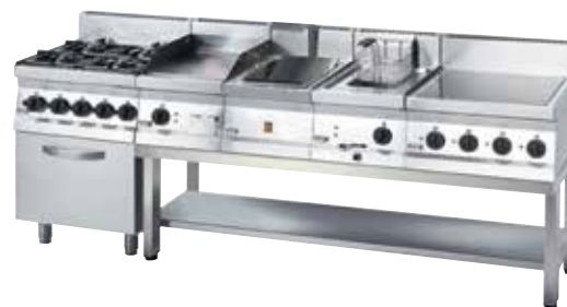
Rozsdamentes acél kivitel, alsó polccal.