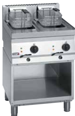
FE6-10 TE + MB6-10

Termosztáttal való hőmérsékletszabályozás: