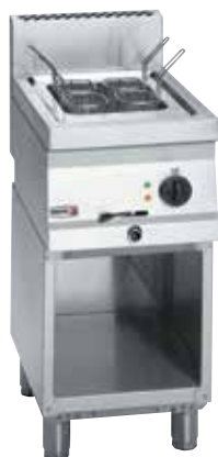
CPE6-05 + MB6-05

A medence anyaga: AISI-316. rozsdamentes acél (a sós víznek ellenálló acél).