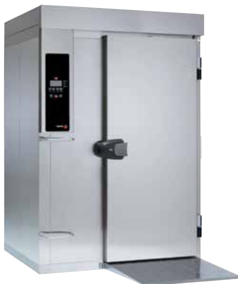
- 202 -

Pl.: alkalmazott tálcák vastagsága 4,5 cm, 30°C hőmérsékleten a párolgás, és 38°C környezeti hőmérséklet.