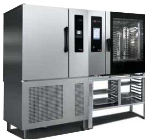
COOK & CHILL 102