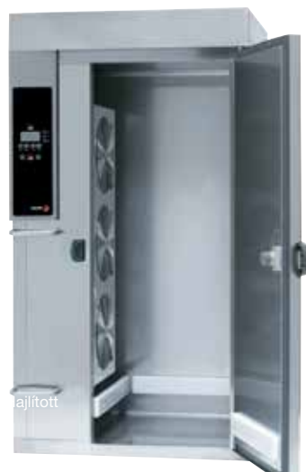
- 201 -