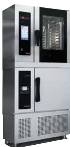
COOK & CHILL 061