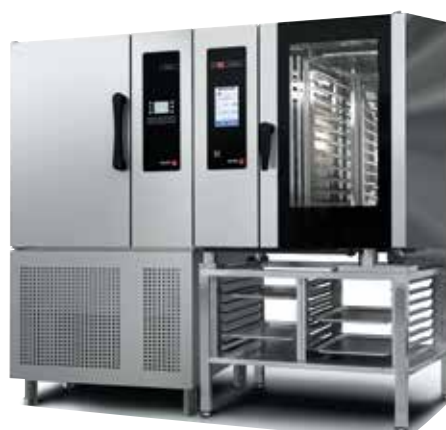
COOK & CHILL 101